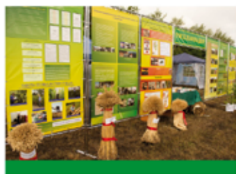
Итоги работы за I полугодие 2016 года

нарушений было выявлено отделами Управления в первом полугодии 2016 г.