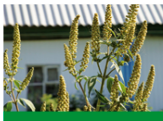
Актуализация карантинных фитосанитарных зон