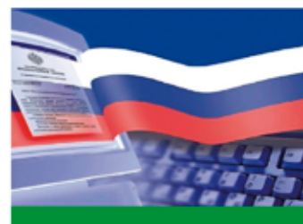
Правовое информирование и правовое просвещение